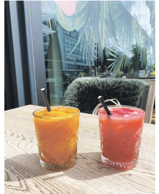
Op het maar liefst 40 meter lange terras van Murni kan je heerlijk van de zon genieten.

Favoriet van de redactie: Pink power, een lekker fris en heerlijk roze sapje.