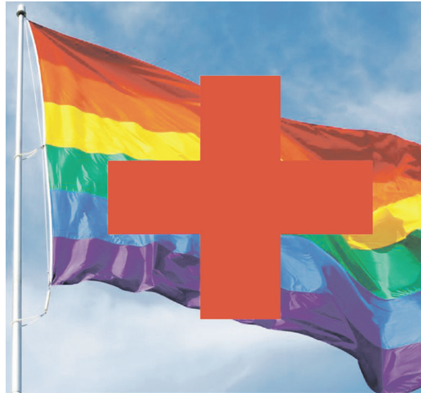
Het Rode Kruis beweert niet te discrimineren.

Volgens het Rode Kruis is de wachttijd voor homoseksuele mannen een kwestie van voorzichtigheid en niet van discriminatie. Lesbiennes mogen namelijk wél bloed doneren zonder een wachtperiode. Ze beweren dus niet uit te sluiten op geaardheid, wel op seksueel gedrag. Dat is simpelweg een andere manier om te formuleren dat ze homoseksuele mannen discrimineren.