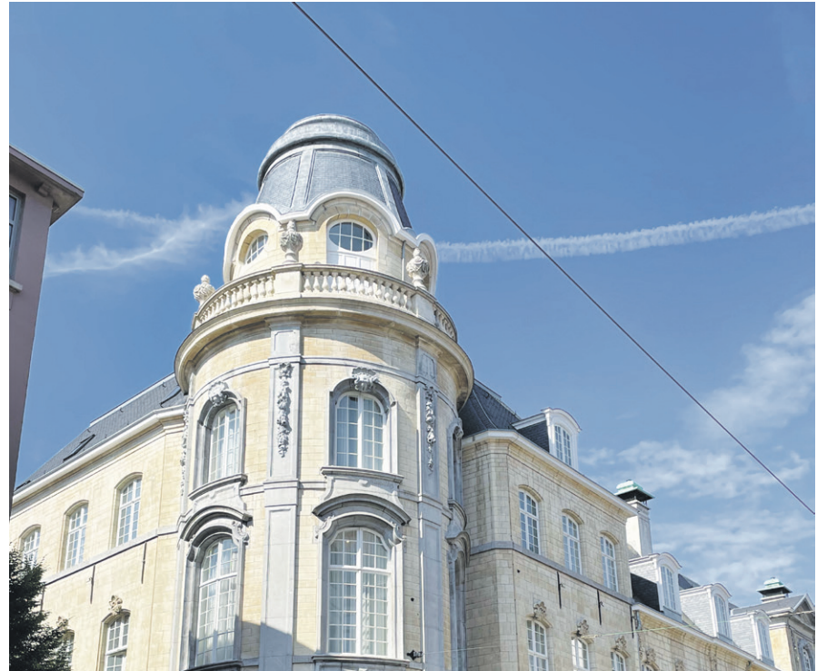
Het pand in de Lange Nieuwstraat was vroeger eigendom van de familie Du Bois.