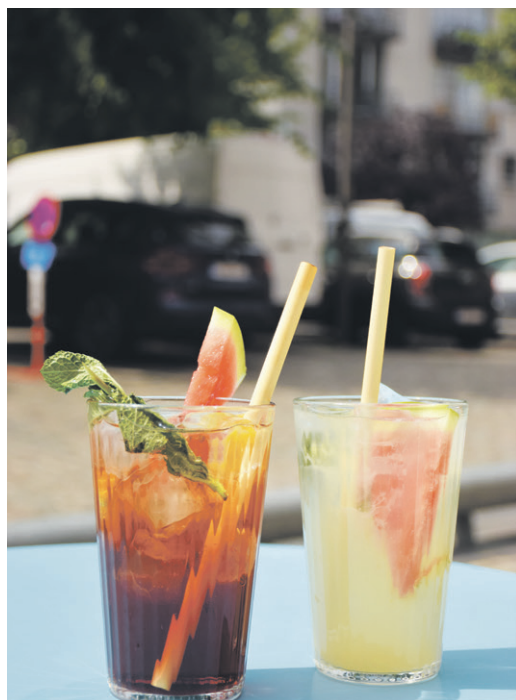
Ook de Saint Ginger (rechts) viel in de smaak bij onze redactie.