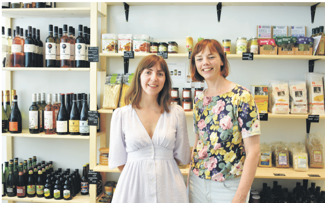
Bij Nieuwe Vaart kan je genieten van een heerlijke tas veganistische koffie tijdens het shoppen.

Behalve dat je er werkelijk elk product in een vegan jasje vindt, kan je bij Nieuwe Vaart ook genieten van vegan koffie in hun coffee corner: “We serveren koffie van branderij Jespers. Zij verkopen hun producten vooral online, maar nu kunnen mensen genieten van een kopje bij ons in de winkel. We hebben er bewust voor gekozen om de ene helft van onze winkel te vullen met winkelrekken en in de andere helft koffie te serveren. We willen ons assortiment eenvoudig houden en door onze koffiehoek creëren we gezelligheid. We zijn ook de enige natuurwinkel die koffie serveert en dat maakt ons uniek.”