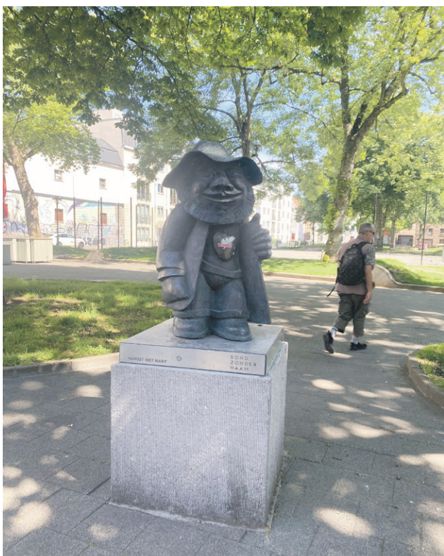
Het Oasemanneke vind je op het Frans Halsplein.