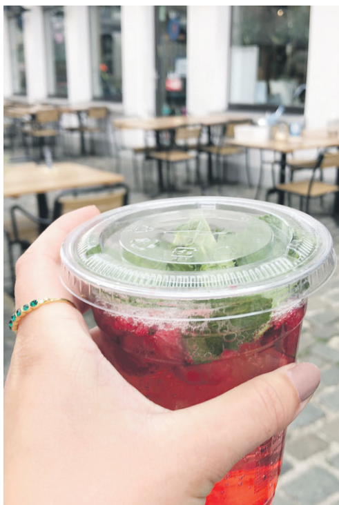
Je kan je fris drankje van de Wasbar ook meenemen.