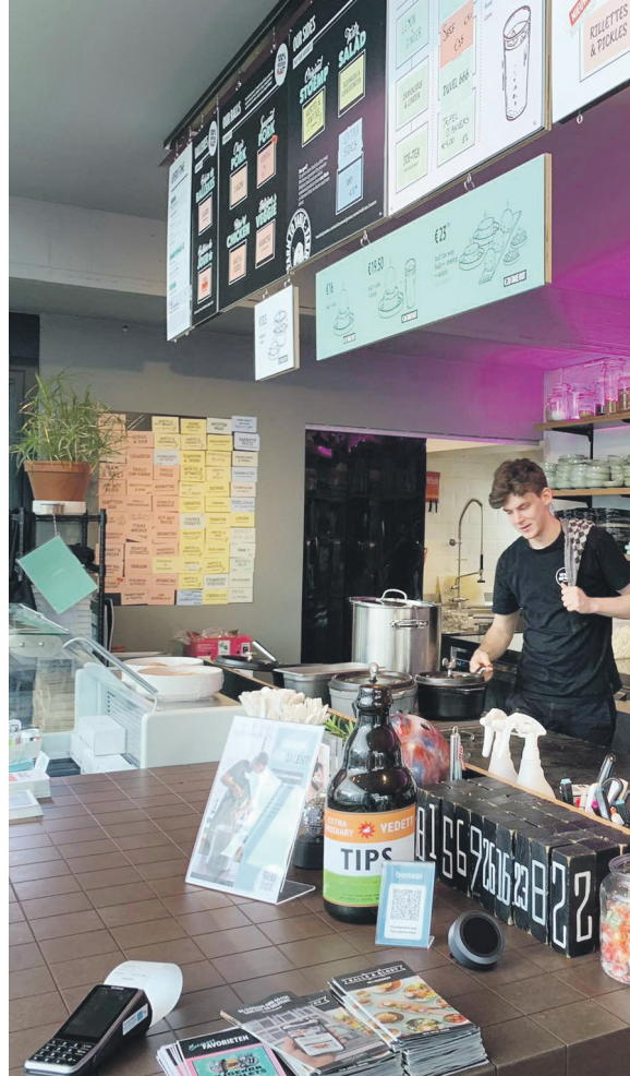
De afbraak staat gepland ten vroegste voor 2026.

Concrete plannen heeft de jonge ondernemer dus nog niet, maar er wordt wel al nagedacht over de toekomst: “We moeten nieuwe plannen bedenken, want we hebben een paar maanden geleden een stappenplan bedacht voor de zaak, maar dat is nu op losse schroeven gezet. Het is jammer dat dat al zo snel in het water valt, maar aan de andere kant is het ook wel spannend en vernieuwend. Blijven we in de buurt? Gaan we naar een totaal andere plek? Dat zijn vragen die we ons stellen, maar deze unieke