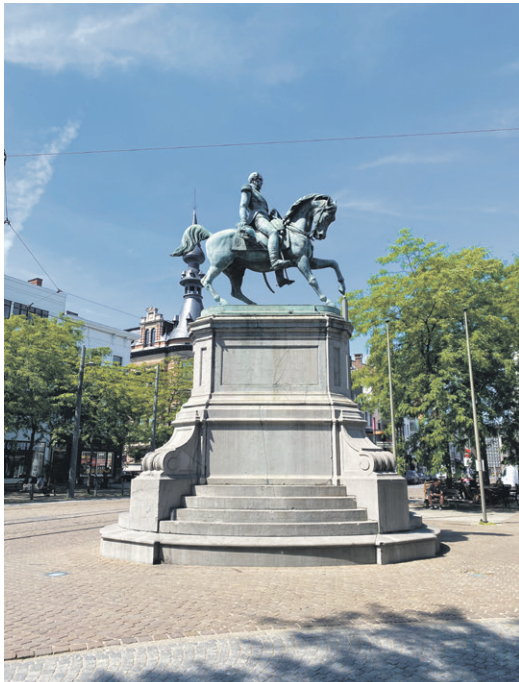
Op de Leopoldplaats vind je, niet zo verrassend, het ruitersstandbeeld van Leopold I.

Op de Leopoldplaats, aan de Nationale Bank, staat een ruitersstandbeeld van Leopold I, de eerste koning der Belgen. Dat hij niet evenveel op zijn kerfstok heeft als zijn zoon Leopold II is geweten, maar als het aan hem had gelegen was dat wellicht anders, want aan pogingen tot kolonisatie ontbreekt het niet. Zijn koloniale nalatenschap bleef uiteindelijk slechts bij die mislukte pogingen.