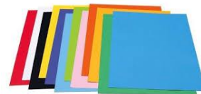
Grote vellen papier