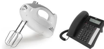
Oude en nieuwe apparaten, machines,...